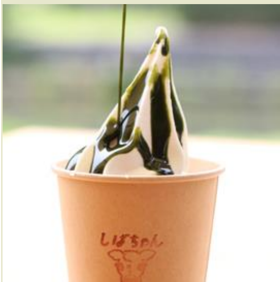
フロート (コーヒー/ココア/お茶) 各 700yen