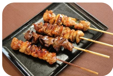
メニュー 焼き鳥弁当 写真はイメージです