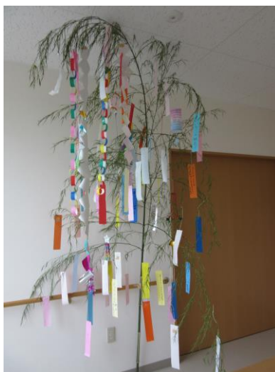
飾り付けた笹。雨続きのため、施設内に展示しました。

七夕飾り作りを行いました。事前にきくがわ作業所と工房オアシスの利用者さんへ短冊を渡し、お願い事を書いていただきました。当日に参加された方の短冊を合わせると、50枚程の願い事が折り紙で作った七夕飾りとともに笹を彩りました。皆さんのお願い事が織姫と彦星に届くと、いいですね。