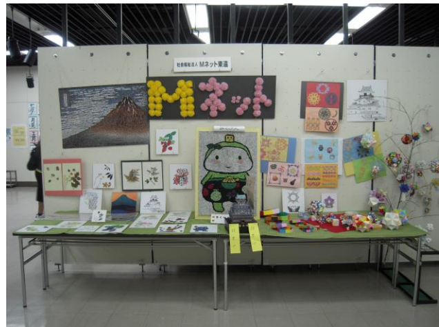
平成26年度の作品です。

出展した作品の、「きくのん」はプラザけやき内に飾って頂き、モザイクアートで作成した富士山は菊川市本所のセンターに飾ってあります。