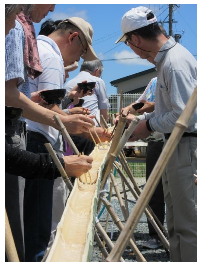
流れる方向に向かって右側に立つと掴みやすいそうです。