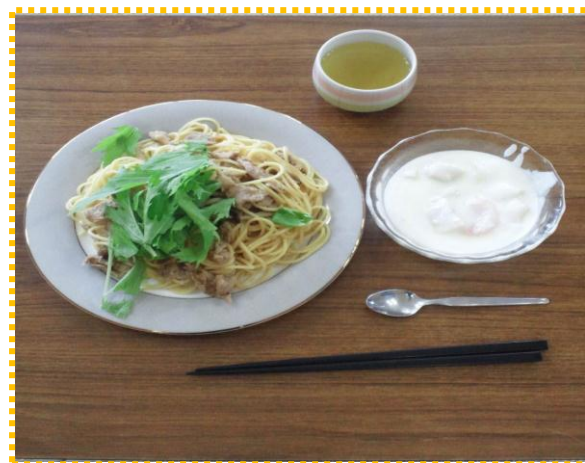
豚肉のみぞれパスタとフルーツヨーグルト

真夏の暑さを考慮してか、今回の菊川サロンでは和風パスタづくりとして、『豚肉のみぞれパスタ』をつくりました。具材として豚肉・大根・みずな・しめじなどが入りました。鍵はポン酢の味付けでした。これまでのパスタとは大分趣が違いさっぱり感がありました。これまでにない新鮮な味でおいしかったとの声が多く聞かれました。