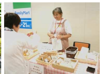
中東遠医療センター2階、ファミリーマートさん横に出店しています。