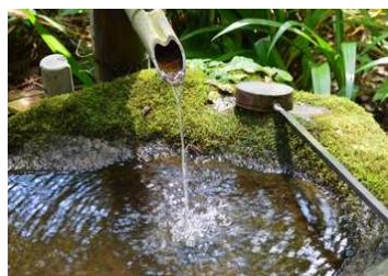
苔むした手水場は趣があります。