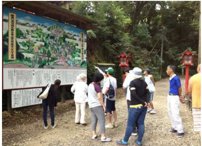
広い境内。迷わないように地図を確認して進みます。

実はこの中東遠医療センターの2階には、Mネットの売店が出店しています。Mネットの作業所で製造したパンやおにぎり、焼き菓子のほか、掛川・袋井市内の作業所の自主製品を販売しています。病院に行かれた際には、ぜひ足を運んでみてください。