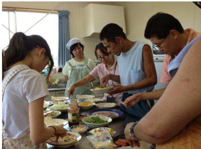
思い思いのトッピングで、オリジナルピザを作ります

見た目も匂いも美味しそうで我慢できません。それでは出来立てのピザを熱いうちに、いただきます！