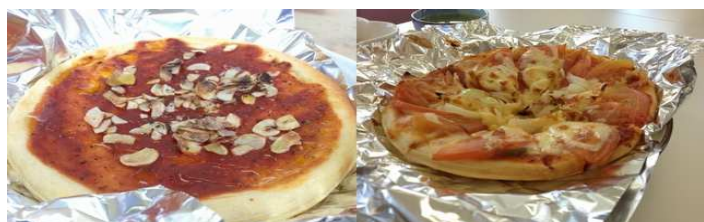
チーズを使わないピザ、トマトたっぷりのピザなど、自分好みのピザができました。焼き具合もバッチリです！